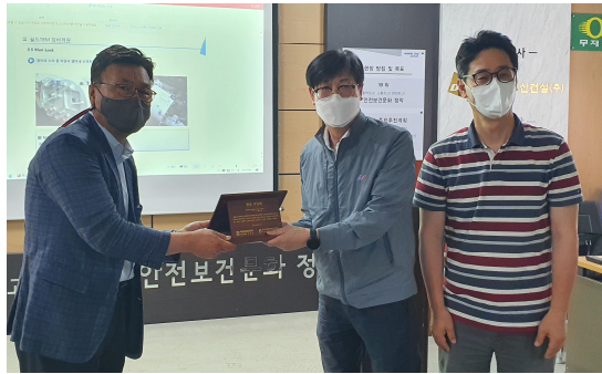
<그림 1. 방문기념패 전달>